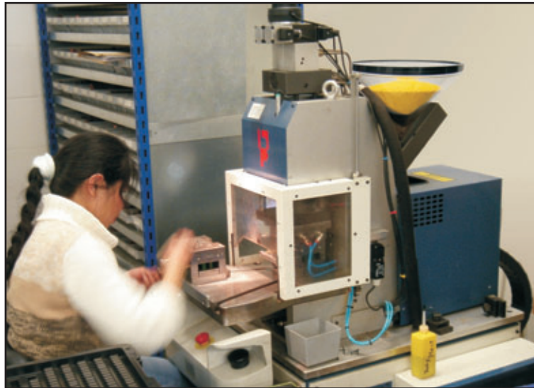
Praxisbeispiel: Manuelle Bestückung eines 2-reihigen Steckverbinders