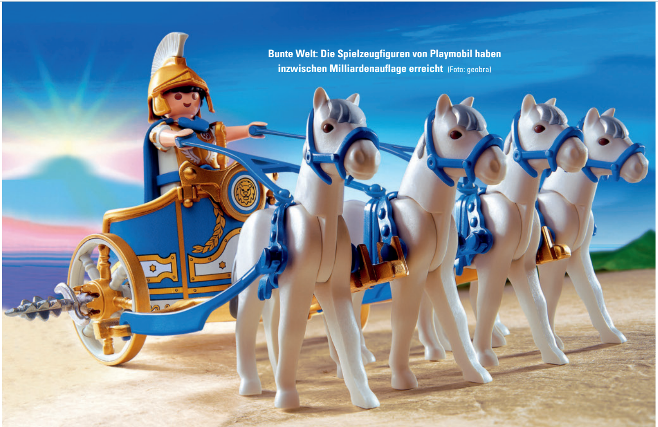
Bunte Welt: Die Spielzeugfiguren von Playmobil haben inzwischen Milliardenauflage erreicht