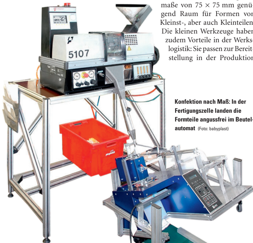
Konfektion nach Maß: In der Fertigungszelle landen die Formteile angussfrei im Beutelautomat

Die Grundphilosophie bei geobra lautet in der Kleinteilefertigung: angussfrei in den Beutel. Bei größeren Maschinen ist das Verhältnis von Anguss zu Teilegewicht oft ungünstig, nicht selten wiegt der Anguss um ein Vielfaches mehr als das Formteil. Und er muss eingemahlen werden. Die →