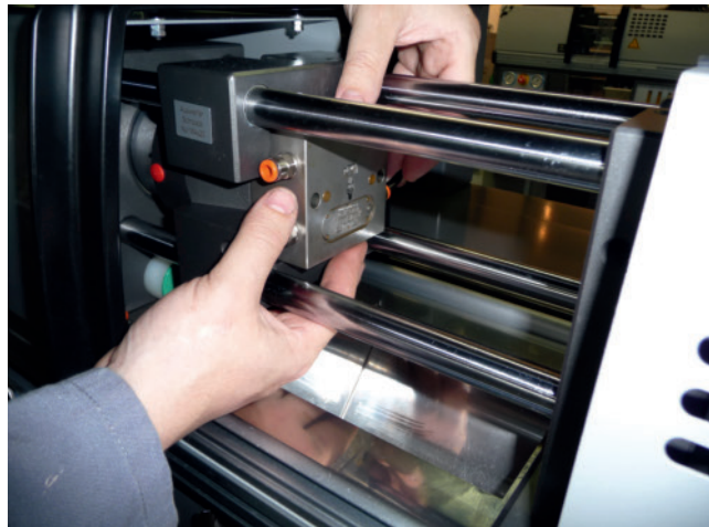
Werkzeugwechsel ohne Hallenkran sparen Zeit

Die früher eingesetzten größeren Spritzgießmaschinen erfordern wegen der hohen Dosierleistung Kaltkanalwerkzeuge. Statt auf viele Kavitäten in Kaltkanaltechnik zu setzen, deren Betriebsrisiko mit der Fachzahl steigt, beschritt geobra bewusst den Weg mit zumeist 2- oder 4-Kavitä-